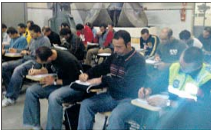
AYUNTAMIENTO DE AIELO DE MALFERIT